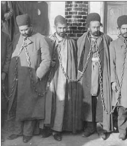
به غل و زنجیر کشیدن جمعی از مشروطه خواهان توسط مامورین محمد علی شاه در بازداشتگاه باغ شاه

شاهد وقوع آنها بوده و به ثبت آنها اقدام نموده است.